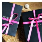
Fancybox Chile. Por fin el fenómeno de las beauty boxes aterrizó en nuestro país