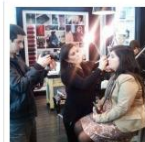
Lecciones de maquillaje Bobbi Brown: Piel Perfecta y Smoke'N'Foxy